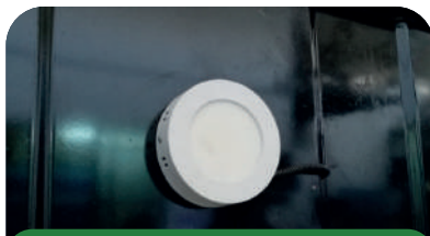
4. Contra incendios