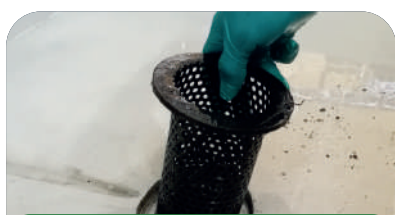
1. Rejilla de Metal