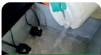
3. Amplio Almacenamiento