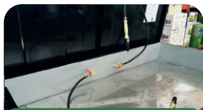
2. Sistema de Drenaje