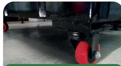
5. Ruedas de alta duración